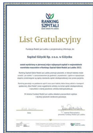
List gratulacyjny z Fundacji "Rodzić po Ludzku"

Ano dlatego, że Giżycka Ochrona Zdrowia Sp. z o.o. znalazła się w najlepszej trójce w wojewódzkim rankingu szpitali, opracowanym przez Fundację "Rodzić po Ludzku" na podstawie ankiety "Głos Matek". To właśnie same pacjentki porodówek wskazały placówki, w których "kobieta może urodzić po ludzku w intymności, prywatności i poszanowaniu godności". Pomysłodawcy rankingu podkreślają, że dzięki zebranych w ankietach informacjom przyszłe matki mogą wybrać szpital, który wychodzi naprzeciw ich oczekiwaniom w kwestii opieki okołoporodowej oraz to, że ten "głos matek" jest coraz silniejszy i już słyszalny nawet na najwyższych szczeblach. Z kronikarskiego obowiązku odnotujemy, iż oprócz naszej GOZ kobiety na Warmii i Mazurach doceniły także dwie placówki olsztyńskie: Miejski Szpital Zespolony i Wojewódzki Szpital Specjalistyczny.