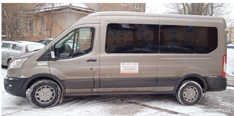
Tym busem realizowany jest transport potrzebujących w ramach usługi "door-to-door"

"door-to-door" realizowany jest od poniedziałku do piątku w godz. 7.00-17.00 (zgłoszenia przyjmowane są w godz. 7.00-15.00).